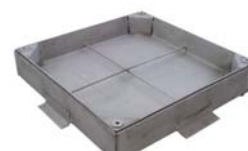
C 310 M RELLENABLE