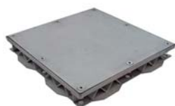
C 305 M PEATONAL