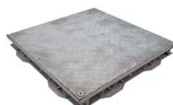
C 306 M PEATONAL ANTIDESLIZANTE